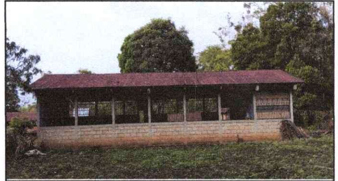
Foto 4: se demuestra que la pared de la escuela necesita pintura ya que esta en muy mal estado.