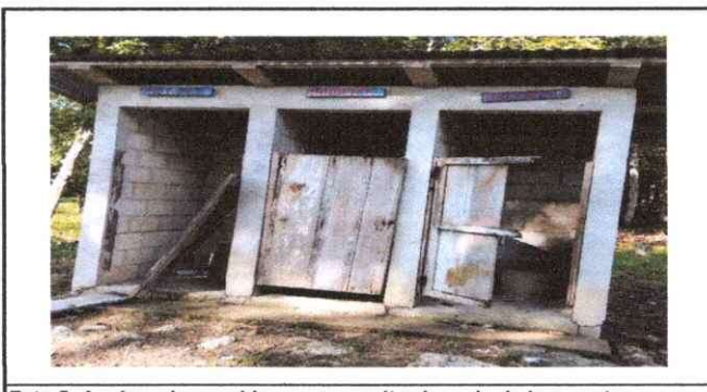
Foto 5: Aquí se observa bien que necesita el arreglo de las puertas ya que estan en mal estado y pintarlo.