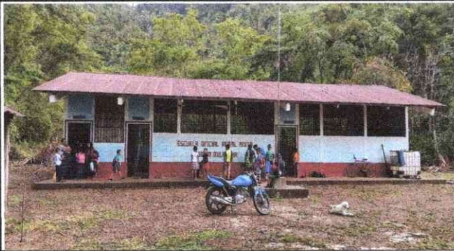
Foto1: Aquí se observa el techo esta en mal estado tiene agujeros cuando es época de lluvia entra el agua.