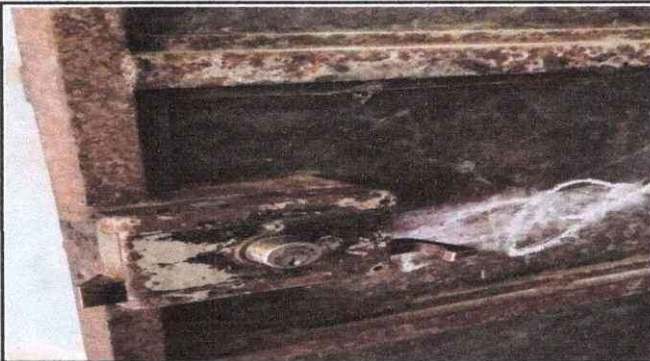
Foto 3: La chapa de la escuela estan en mal estado ya no funcionan y las puertas necesita pinturas .