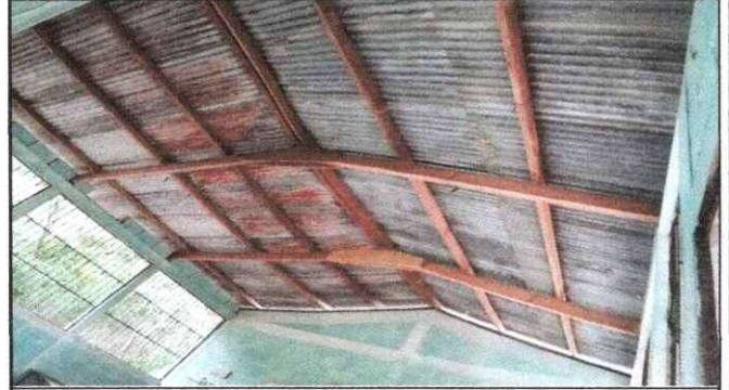
Foto 2: Aquí se demuestra que las costaneras y vigas que es de maderas ya estan en mal estado.